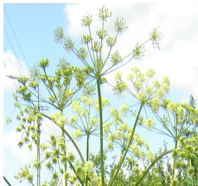
Fot. 2. Kwitnące baldachy