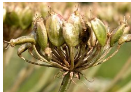
Fot. 5. Baldaszek z dojrzewającymi rozłupkami (nasionami)

Ulotka nie jest przeznaczona do celów komercyjnych