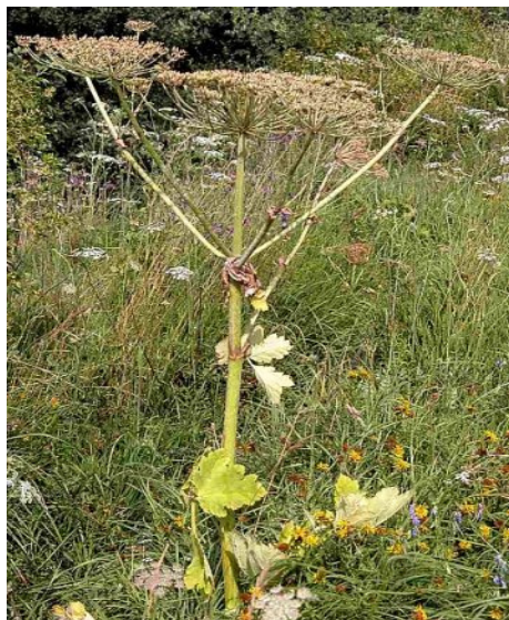
Fot. 4. Pęd z dojrzewającymi baldachami (rozłupkami)