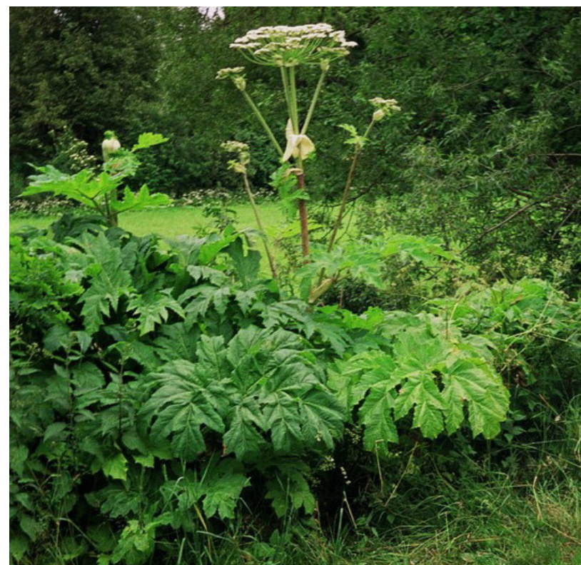
Fot. 1. Kwitnąca roślina barszczu Sosnowskiego