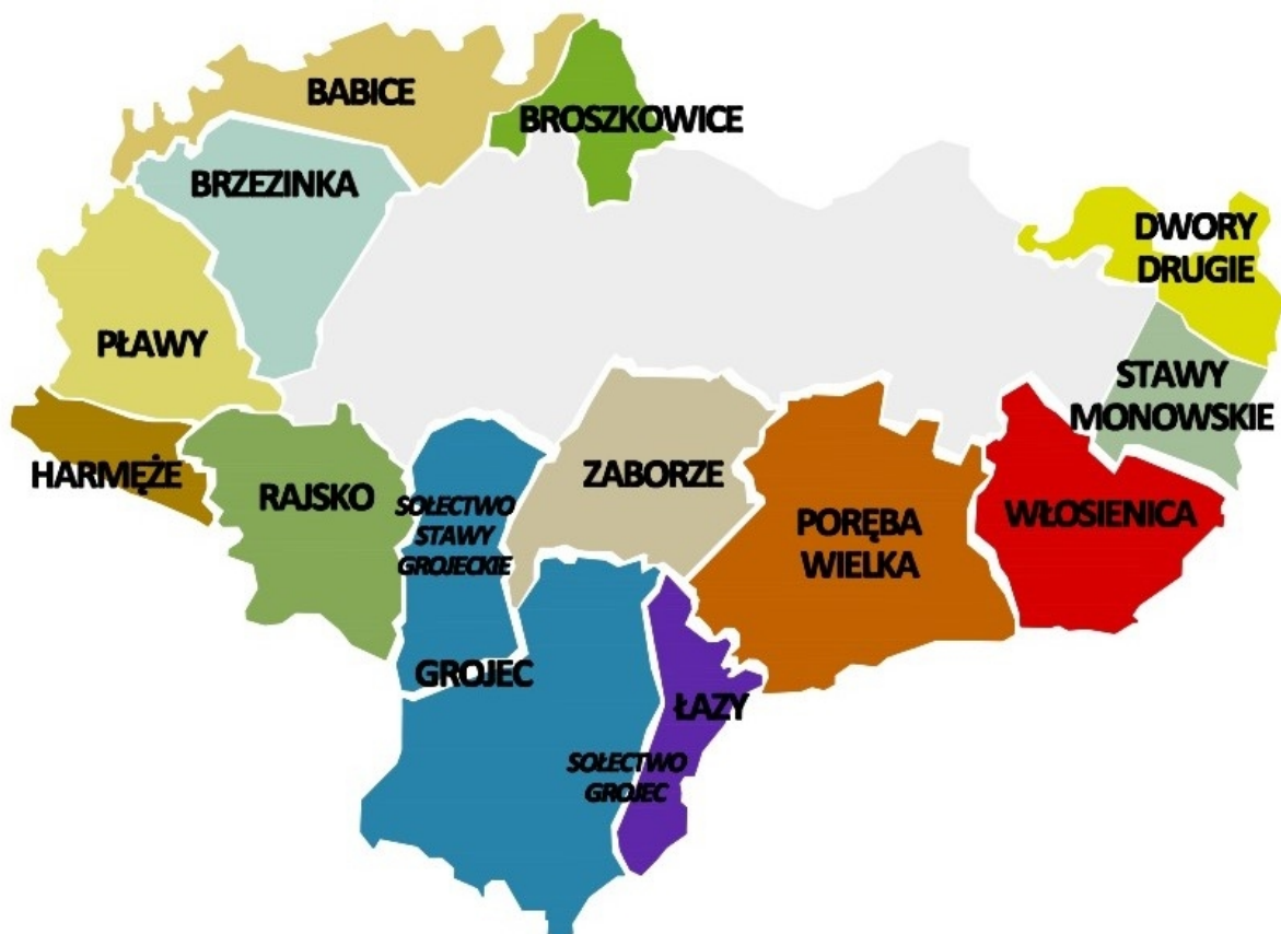
Rys. 2: Sołectwa Gminy Oświęcim

Gminę tworzy 13 miejscowości: Babice, Broszkowice, Brzezinka, Dwory Drugie, Grojec, Harmęże, Łazy, Pławy, Poręba Wielka, Rajsko, Stawy Monowskie, Włosienica, Zaborze, zorganizowanych w 13 sołectwach (miejscowość Łazy wchodzi w skład sołectwa Grojec, a miejscowość Grojec jest podzielona na dwa sołectwa: Grojec oraz Stawy Grojeckie).